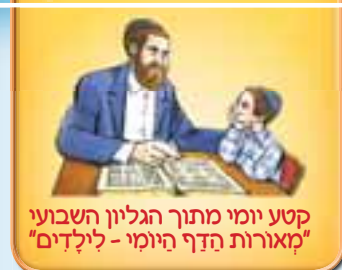
קטע יומי מתוך הגליון השבועי "מאורות הדף היומי - לילדים"

אמירה מעניין השחיטה אינה הפסק: לגבי השוחטים שנאלצו לומר "אלל"ה וואכב"ר", הורה בעל "תבואות שור" בניגוד לדעת ה"פרי חדש", כי אמירה זו אינה מהווה הפסק בין הברכה לבין השחיטה, משום שהיא אמירה בעניין השחיטה ורק אמירה מעניין השחיטה מהווה הפסק.