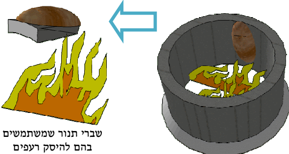
שברי תנור שמשמשים בהם להיסק רעפים

רב אשי : מדוע הברייתא עסקה דווקא בטלטול שברי כלי תנור? יכולה היא לעסוק בטלטול התנור עצמו, ולהביא את מח' רבי יהודה וחכמים בתנור באוויר בהיסק ראשון: לרבי יהודה אינו נחשב כלי ואסור בטלטול (וכ"ש ששבריו אינם כלים ואסורים בטלטול), ולחכמים מותר בטלטול? אלא המחלוקת בברייתא היא כעין המחלוקת במשנה (כדעת רבא), האם צריך להיעשות בשברים כעין המלאכה המקורית של הכלי להתיר לטלטל. ונחלקו במשנה רבי מאיר וחכמים בשברי סתם כלים, ונחלקו בברייתא בשברי תנור שיכול לעשות בהם "היסק רעפים" (לשים את הדבר הנאפה מעל השבר כלי, כמו היסק ברעף, והאש תבער מתחת). רבי מאיר סובר שבשברי תנור שאפשר להסיק בהם כרעפים, יודה לו רבי יהודה שמוותרים בטלטול (לשיטתו אפשר לכסות בשברים כלי, ולשיטת רבי יהודה אפשר להסיק בהם כעין מלאכתם המקורית). רבי יהודה סובר שברי התנור מוקצה, ואין מועיל שניתן לעשות בהם "היסק רעפים", שאין דימיון בין "היסק תנור" ל"היסק רעפים" - וממילא אין הסקה זו כמלאכה המקורית. מפני ש: בתנור האש בתוכו, וברעף האש מתחתיו. בתנור הבצק דבוק במעומד לדפנות התנור, וברעף הבצק שוכב על החרס.