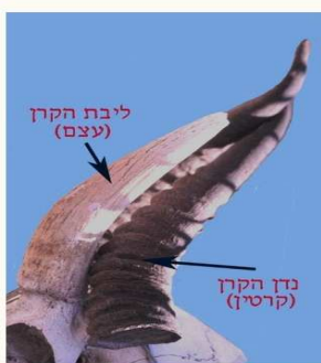
תמונה 2. קרן צבי לאחר הסרתה מבסיס העצם