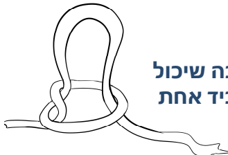
קשר עניבה שיכול להיתרו ביד אחת