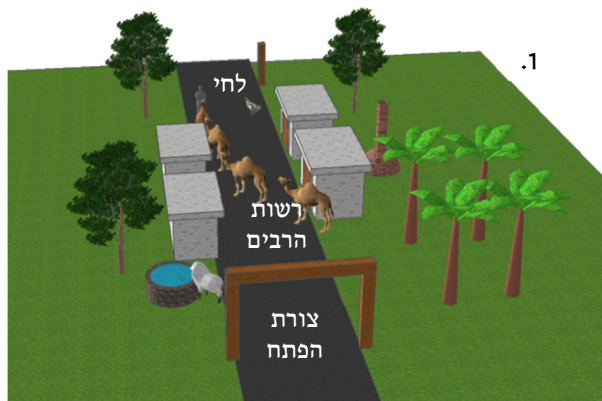
1. להתרת העיר בטלטול עושה צורת הפתח מצידה האחד ולחי מצידה השני