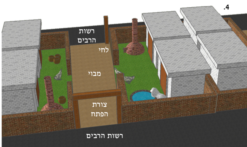
4. להתיר מבוי שנמצא בין שני דרכים של רשות הרבים יש להעמיד צורת הפתח ולחי בצדי המבוי (תוס' ד"ה "וכי תימא")