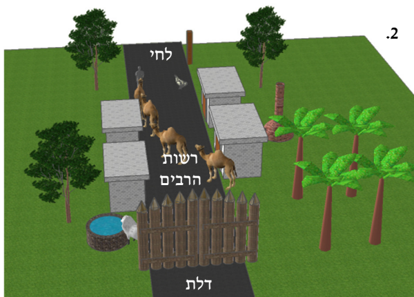
2. בית הלל: להתרת העיר בטלטול עושה דלת מצידה האחד ולחי מצידה השני