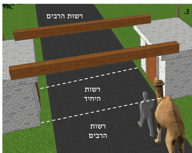
3. לרבי יהודה די בשתי מחיצות מעולות ליצור רשות היחיד, לכן צריך היכר של שתי קורות לטלטל ברשות היחיד