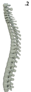
בית הלל: ניטלה אחת 33 חוליות השידרה – אינה מטמאה בטומאת אוהל