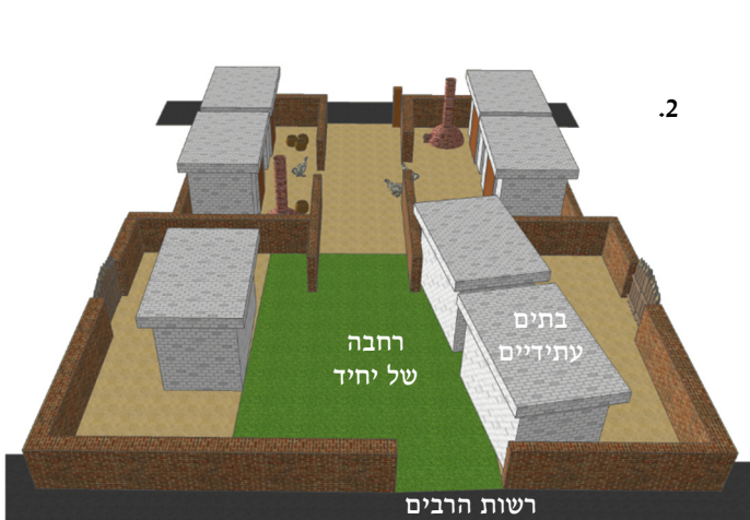
רב משרשיא: במבוי הפרוץ לאמצע הרחבה, רב יהודה מתיר בתנאי שהרחבה אינה של יחיד שיכול לבנות בתים מפתח המבוי עד פתח הרחבה