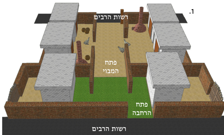
רבה: במבוי הפרוץ לאמצע הרחבה, רב יהודה מתיר בתנאי שפתח המבוי לא כנגד פתח הרחבה