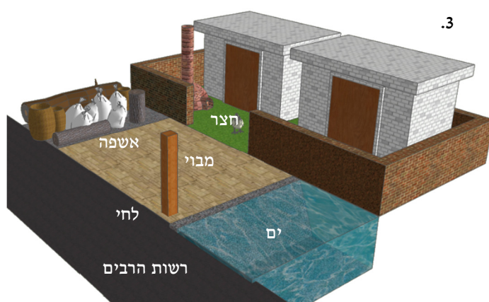
מבוי שמצידו האחד יש ים (שפת הים היא מדרון תלול, שיורדת עשרה טפחים בארבע אמות) ומצידו השני אשפה (בגובה עשרה טפחים)