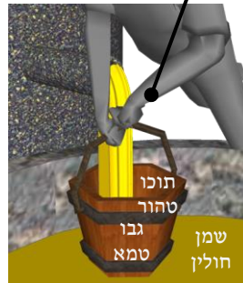
גת התחתונה שיש בה שמן חולין טמא

לכו"ע אם יכול להציל שמן רביעית שמן תרומה – מציל, אפילו בכלי שגבו טמא ותוכו טהור (אע"פ שיש חשש שהשמן יטמא מגב הכלי)