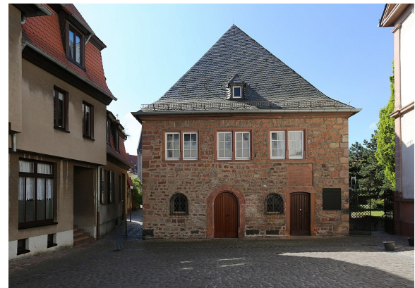
בתמונה: בית המדרש בו למד ולימד רש"י ע"פ המסורת. ניתן לראות את שיפוע גג ביהמ"ד וגגות המבנים שבסמוך.

גם לגבי סוכה לשון הגמרא בכל מקום ש"עולים לסוכה" או "יורדים ממנה", ומבאר רש"י בכמה מקומות שהסוכות שלהם היו על הגג, כי גגותיהם לא היו משופעים.