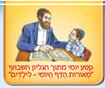
קטע יומי מתוך הגליון השבועי "מאורות הדף היומי - לילדים"