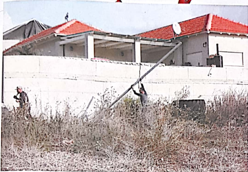
נענים לבקשת התושבים. עבודות ההקמה של העירוב

"לא רציתי לצער אותם, והעובדים שלנו פירקו את כל מה שעמלנו להתקין וממש ראית את האור בעיניהם..."