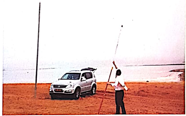
מחשבה ומאמץ. צוות העירוב במהלך העבודה