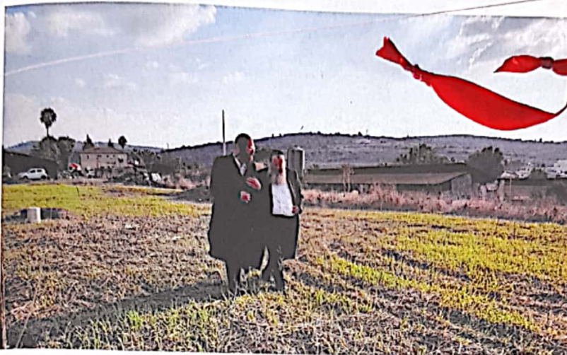
שנים של טורח. סופר 'בקהילה' יאיר וינשטוק עם הרב רוזנבוים בשדות ישראליים