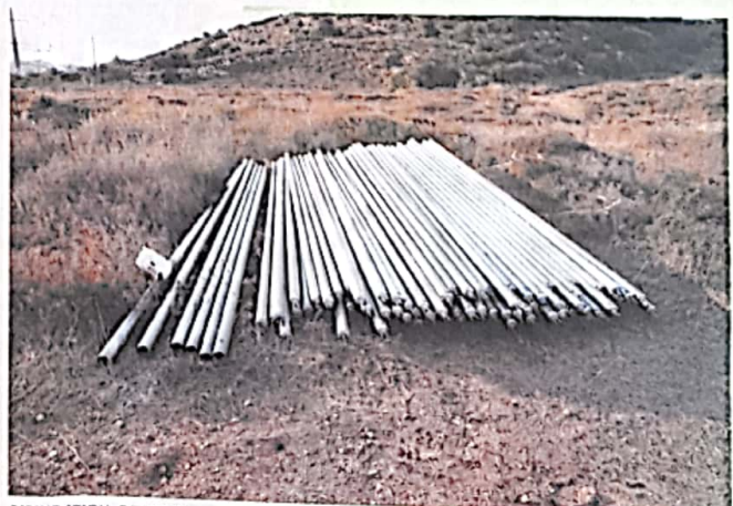
ציוד יקר. עמודי העירוב