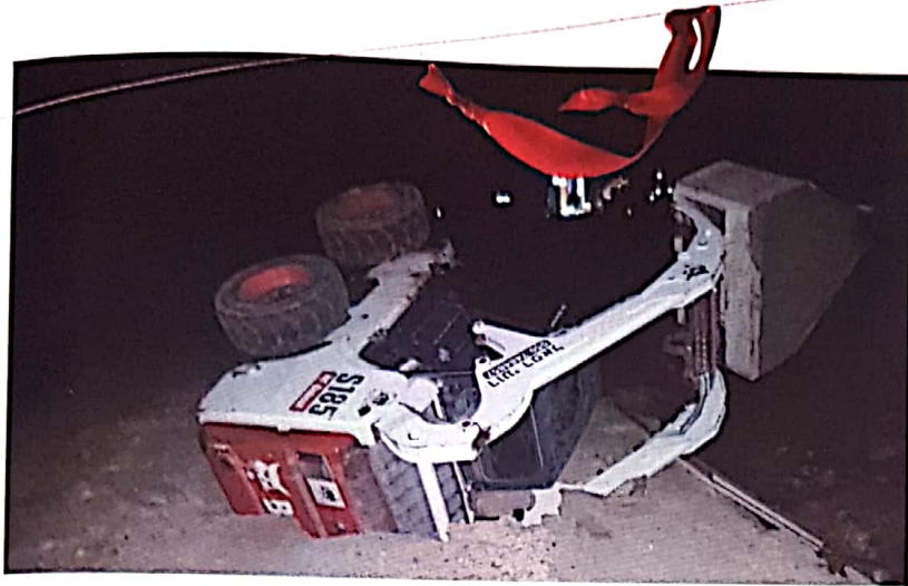
תפתח הארץ. הטרקטורון שנפל לבולטן

מזאת צריך גם שיהיו עירובי חצרות כידוע - כל הדיירים בחצר צריכים להשתתף במאכל כגון פת (בדרך כלל מקובל לעשות זאת במצה שעמידה לאורך ימים). ביישוב גדול כמו ירושלים ישנם הרבה עירובים. של בד"צ העדה החרדית, של הרבנות ושל כל מיני גופים שונים. מספיק שבני עירוב שכונתי קטן התקינו עירובי חצרות כהלכה - והם מזכים את כל בני העיר בעירוב החצרות שלהם, אבל ביישובים קטנים הרי אין לך יותר מאשר עירוב אחד, ואם לא סודר עירוב חצרות, העירוב הגדול אינו שווה פרוטה שחוקה..."