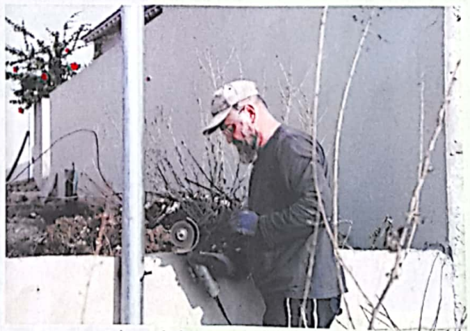
לא להפריע לנוף. מנסים את העמוד