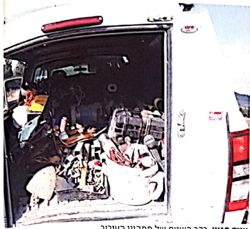
ציוד מגון. רכב השטח של מתקיני העירוב

את כל הצדדים ההלכתיים של עבודתו. כעת הוא מסביר לנו כי למעשה הטיפול שאנו רואים הוא פרוביזורי, מאחר וכל המקום עומד לעבור פיתוח וממילא יעקרו כל העמודים בקרוב. לאחר הפיתוח תונח במקום תשתית עירובין חדשה ומהודרת.