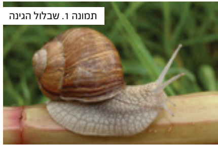
תמונה 1. שבלול הגינה

בחולין (קכב ע"א) פירש רש"י: "חומט - לימצ"א שתחלת בריותו בכעדה. צא ובדוק בתיק שלה שגדל והולך עמה תחלתו כעדה ממש הוא בשוליו" (בדומה לכך פירש גם בסוגייתנו). מסתבר שכוונתו במשפט "בתיק הגדל עמה" היא לקונכייה המאפיינת את מחלקת החלזונות. גם בפירושו לתורה (ויקרא, יא ל) כתב כך: "החמט - לימצ"א". בצרפתית בת ימינו limace היא חשופית, כלומר חלזון ללא קונכייה השייך לסדרת השבלולים (מקובל להבחין בין השם חלזון שהוא שמה של מחלקת החלזונות לבין השם שבלול המתייחס לבני סדרת השבלולים) אך שם זה כולל גם את