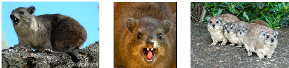
גי תמונות של ה-"הירקס"

לצערינו הרב בספרים רבים 2 כולל גמרות וחומשים, נכתב בפירוש או רמוז בתמונות, שהשפן המוזכר בתורה בפרשיות שמיני וראה הוא ה-"הירקס" ("שפן הסלעים" או "שפן הסורי" או "שפן ההרים" או מה שנקרא היום בכמה מדינות ערב "אל ובר"), ולעניות דעתי נראה שאין זה נכון כפי שאבאר בעזהש"י בהמשך, שמונה קושיות לשיטתם: