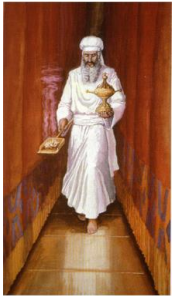
וידוי על חטאי העם

(טז) וכפר על הקדש מטמאת בני ישראל ומפשעיהם לכל חטאתם וכן יעשה לאהל מועד השכן אתם בתוך טמאתם: