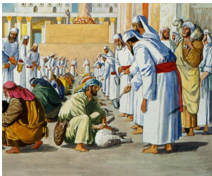
שחיטה וקבלת הדם. על פי דעת רש"י, העושה את העבודות הללו מפגל אם חשב בהן על "אכילת מזבח", אבל המחשבה עליהן אינה מפגלת.

בשיטת רש"י הלכו כמה מן הראשונים: תוס' (ט, ב ד"ה מחשבין), רי"ד, ומפרשי התורת כהנים (ויקרא וצו שם): רבנו הלל, הפירוש המיוחס לר"ש, ופירוש 'תוספות אחרות'.