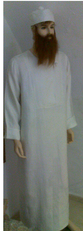
מחוסר בגדים. התמונה היא צילום ממכון המקדש, ובה כהן הלובש את בגדי הכהונה (צורת המצנפת - כשיטת 'מדרש לקח טוב' בפירוש המושג 'פארי המגבעות', עיין 'שערי היכל' למסכת יומא, מערכה קעח). כהן זה חסר אבנט, ולפיכך הוא "מחוסר בגדים", הפסול לעבודה.

לבישת בגדי הכהונה על ידי הכהנים בשעת העבודה היא מצות עשה מן התורה (הל' כלי המקדש י,ד; ספר המצוות לרמב"ם מ"ע לג; סמ"ג עשה קעג; חינוך צט). יש מי שמנה מצוה זו במצוות לא תעשה, כלומר שאין לעבוד ללא הבגדים (בעל הלכות גדולות, אות סח), ולדעתו אין לבישת הבגדים אלא הכשר העבודה (רמב"ן בהשגתו לספר המצוות שם).