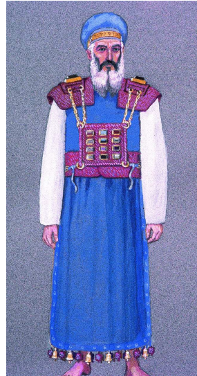
חשב האפוד - שיטת הראב"ד. גם לדעת הראב"ד החושן נקשר על הלב, כמפורש בתורה, אבל חשב האפוד נקשר, לדעתו, למטה מן הטבור.

הרמב"ם (הל' כלי המקדש ט,יא) כותב שחשב האפוד נקשר כנגד הלב, ואילו הראב"ד כתב שהחשב למטה מן הטבור, ובכסף משנה ביאר שטעם הרמב"ם משום "לא יחגרו ביזע". נראה, אם כן, שהרמב"ם והראב"ד חלוקים בשאלה