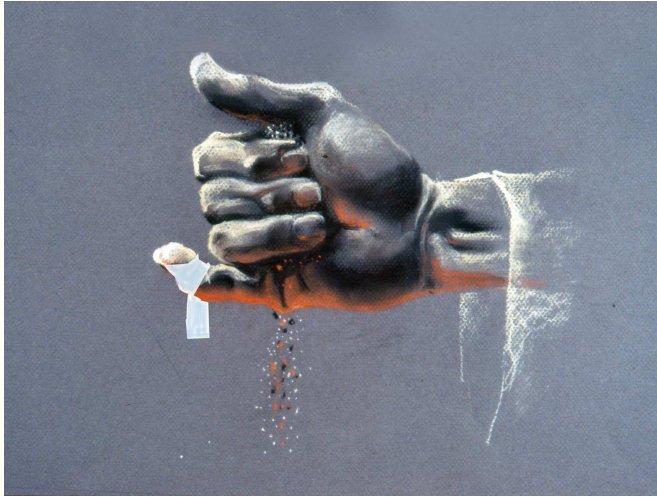
כהן כורך צלצול קטן על אצבעו. הצלצול הוא סרט בד, שאין ברוחו ג' אצבעות. בכל זאת, על פי דעת רבי יהודה בנו של רבי חייא, יש בכריכתו משום "יותר בגדים", מפני שיש בו חשיבות.

אפוא, שגם הל' ח עוסקת בסוג זה של חציצה, וכוונת הרמב"ם לחלק כך: כאשר יש חציצה בין בשרו לבגד, או בין בשרו לכלי – אפילו נימה אחת חוצצת (כלשונו בהל' ו: "אפילו נימה אחת, אם היתה בין בשרו לבגד – הרי זו חציצה ועבודתו פסולה"). ואילו כאשר החציצה איננה במקום הבגדים – הרי היא חוצצת רק בשיעור ג' אצבעות. נמצא שאף לדעת הרמב"ם אסור להוסיף בגד שלא במקום בגדים, אבל אין זה מדין "יותר בגדים" אלא מדין "חציצה" 7 .