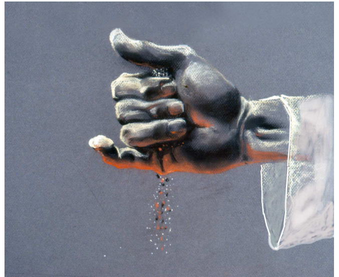
אוויר בין הבגד לגוף הכהן בשעת הקמיצה. רבא מסופק האם רוח הנכנסת בין בגדו לבשרו פוסלת את העבודה, או שמא כך היא דרך הלבשה.

א. רוח הרחיקה את בגדו מבשרו : מצד אחד, כעת הבגד אינו צמוד לבשרו, והאוויר חוצץ ביניהם 8 ; ומאידך, כך דרך בני אדם בלבישתם 9 .