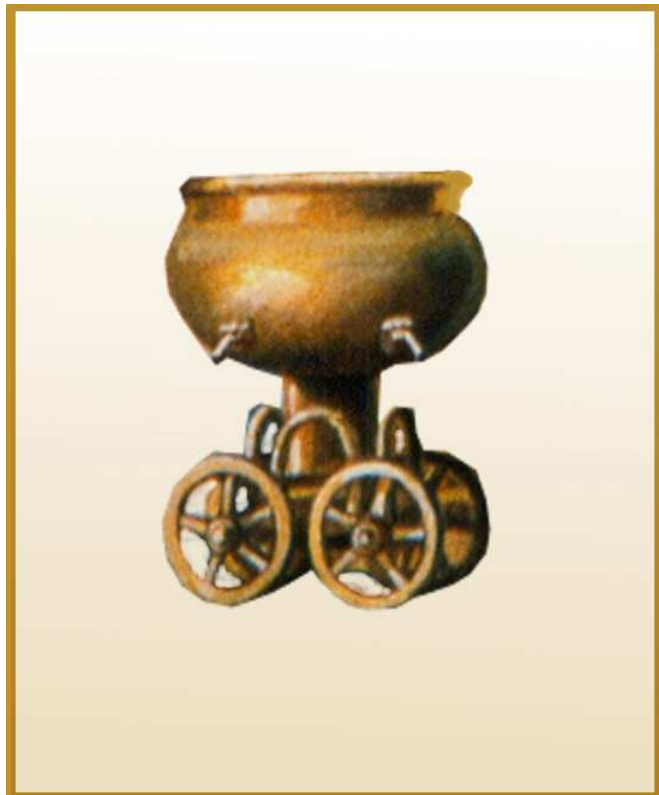
עגלה להסעת הכיור. רבנו אליקים (מן הקדמונים, בדורו של רש"י) בפירושו למסכת יומא כותב שהמוכני הוא מכונה ששימשה להסעת הכיור ממקום למקום, בדומה למכונות שעשה שלמה המלך במקדש ראשון.

המוכני מוזכר במשניות בתמיד (פ"א מ"ד; פ"ג מ"ח), כמתקן מעץ שמופעל לצורך קידוש ידיים ורגלים עם שחר, וקולו החזק נשמע למרחקים. הגמ' ביומא (לז,א) מסבירה: "מאי מוכני? – אמר אביי: גלגלא דהוה משקעא ליה". רוב