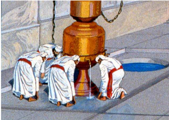
כל כיוור שאין בו כדי לקדש ארבעה כהנים ממנו - אין מקדשין בו. דין זה נלמד מהגדרת ייעודו של הכיוור בתחילה, לרחיצת משה אהרן ובניו.

סיוע להבנה זו, שמדובר על כמות המים בפועל, מקושיית הגמ' מן הברייתא: "כל הכלים מקדשין, בין שיש בהן רביעית בין שאין בהן רביעית". לכאורה יכלה הגמ' ליישב קושייתה בנקל, ש"בין שיש בהן" היינו מים בפועל, ואילו ריב"ח הסתפק בגודל בלבד! ומשלא תירצה כך, משמע שריב"ח הצריך כמות מים הראויה לד' כהנים. אלא שיש לדחות, שהגמ' לא תירצה כך משום שמלשון הברייתא "כל הכלים מקדשין" משמע, שבאה לחדש דין בהלכות הכלי הראוי לקידוש, ולקבוע שאפילו כלי קטן כשר לכך 8 .