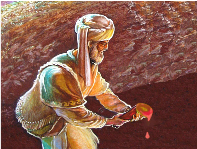
הרוטב - שיטת רש"י: נוזל הפורש מן הבשר עצמו.

לגבי הפיגול והנותר היה מקום לתרץ, שהפטור נאמר במקרה שרק לאחר הבישול נעשה הקרבן נותר ופיגול (לו יצויר שיספיקו לבשלו לפני זריקת הדם), ובכהאי גוונא אין טעם איסור במרק, כי אין בו ממשות בשר שהאיסור יחול עליה מלכתחילה (עיין כיוצא בזה בנדרים פ"ו מ"א), אבל לגבי הפטור על טומאת הגוף אין מקום לתרץ כך.