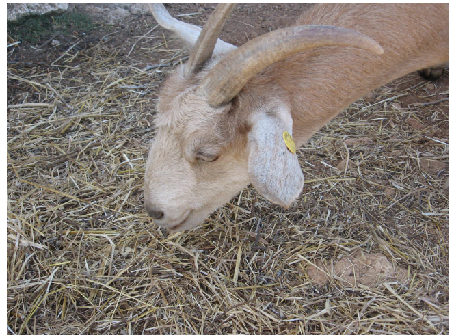
הקרניים ומקום חיבורם לראש. בגמרא בחולין וברמב"ם מוסבר שהחידוש במשנתנו לגבי הקרניים הוא שאפילו מקום חיבורן לגוף הבהמה איננו ראוי לאכילה ואינו מתפגל.