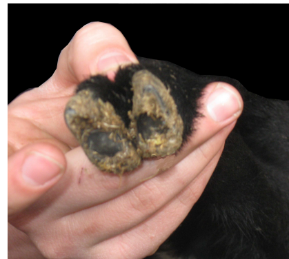
הטלפיים ומקום חיבורם לרגל הבהמה. גם החלק הרך שבמקום החיבור אינו מתפגל, בדומה לקרניים.

הדין השנוי במשנתנו, שהחושב לאכול מן העצמות, הגידים, הקרניים והטלפיים לאחר זמנם לא פיגול, משום שאין הם "דבר שדרכו לאכול", מעורר שאלה: מה הדין אם חשב להקטיר את עצמות או גידי העולה לאחר זמנם? יסוד הספק,