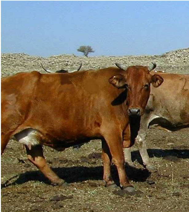
חלב המוקדשין. החלב שבעטיני הבהמה איננו חלק מן הקרבן, ואם הקרבן התפגל - החלב איננו פיגול. במשנה במעילה (פ"ג מ"ה) אף נאמר שאין מועלים בו, אם כי אסור ליהנות ממנו.

הרמב"ם (הל' פסולי המוקדשין יח, כב) השמיט את חלב המוקדשין, ולא הזכיר אלא את ביצת העוף. באור שמח שם מסביר שהרמב"ם השמיטו מפני פשטות הדבר, על פי מה