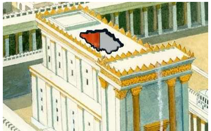
נפחת גג ההיכל. מרש"י נראה ש"נפחתה התקרה" היינו גג ההיכל, המשמש כתקרה לעלייה (דרך החור נראית הפרוכת הפרוסה גם בעלייה, במקביל לפרוכת בקומה התחתונה בין הקדש לבין קדש הקדשים).

ההיכל בנוי משתי קומות (מידות פ"ד מ"ו): בתחתונה נמצאים כלי המקדש: הארון, השלחן, המנורה ומזבח הקטורת, ובו נעשית עבודת החטאות הפנימיות. לעליונה אין שימוש מסוים לעבודה כלשהי (תוספתא כלים א,ז). יש לדון על איזו תקרה מדובר בסוגייתנו.