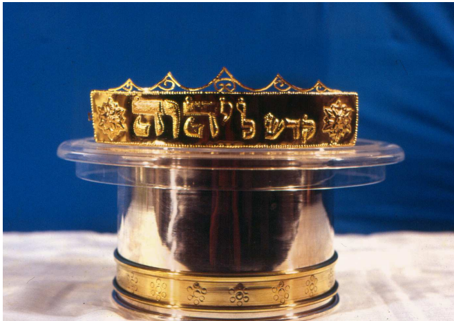
ציץ זהב במכון המקדש. לציץ יש תפקיד בריצוי על קרבנות שהוקרבו בטומאה, אך זאת בקרבנותיהם של ישראל בלבד.

מקור נוסף לעניין זה מופיע בספרא (אחרי מות פרשתא ח,ה) על הפסוק: "ואני נתתיו לכם על המזבח לכפר" (ויקרא יז,יא), שם נאמר: "לכם – ולא לאחרים", כלומר, שאין לגוים כפרה. הפירוש המיוחס לר"ש מבאר, שהכוונה שהציץ אינו מרצה לגוים, ולכן כשנטמא דם הקרבן וזרקו – לא הורצה, ולא יקטיר את האימורים, והגוי לא יצא ידי חובת נדרו 4 . והראב"ד פירש אחרת, שהגוים אינם מביאים חטאת ואשם.