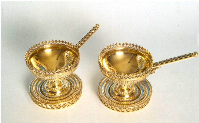
זיכי הלבונה במכון המקדש (צילום). הלבונה משמשת במקדש הן כתוספת למנחות והן כ'אזכרה' ללחם הפנים (ויקרא כד,ז), ובנוסף לכך היא אחד מסמני הקטורת.

לדעתם מה שנאמר כאן שיש בעצים ולבונה "פסולא בעלמא" פירושו שיש איסור דאורייתא באכילתם בטומאה, אבל לא מלקות. אף הגמ' בפסחים הנ"ל האומרת שדין עצים ולבונה הוא "מעלה" פירושה: מעלה מיוחדת מדאורייתא, כפי שפירש רש"י עצמו שם (ד"ה תנינא) לגבי דוגמא אחרת שהובאה שם ל"מעלה" בקדשים 17 .