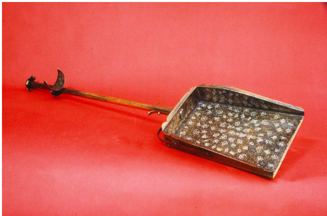
מחתת הנחושת לחתיית הגחלים (צילום המחיתה במכון המקדש). לדעת רש"י (לד, א ד"ה שקדשו) העצים הנדונים בסוגיה כאן, לעניין חיוב נותר וטמא, הם אלו שהתקדשו בכלי שרת על ידי החתייה.

מדוחק הקשיים הציעו כמה אחרונים, שהרמב"ם פוסק כחכמים שחייבים כרת ומלקות על עצים ולבונה, ומה שפטר הרמב"ם הוא דווקא בטרם נתקדשו בכלי (מרכבת המשנה; מעיין גנים וזבח תודה). זאת, על פי הגמ' (לעיל לד, א) שאין לוקים על אכילתם בטומאת עצמן לפני הקידוש בכלי, והרמב"ם למד מכך גם לגבי טומאת הגוף. מלבד הדוחק באוקימתא זו ברמב"ם, לא מובן מדוע הכליל הרמב"ם את הפיגול עם הנותר והטמא, שהרי אין בהם פיגול אפילו אחר שנתקדשו בכלי.