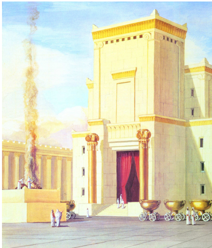
מזבח בית ראשון עשוי אבן. בתמונה נראה בית המקדש הראשון (ראה את עמודי "יכין ובוועז" ומכונות הנחושת), ובחצרו עומד מזבח אבנים, כפי שהיה בבית המקדש השני. זוהי הדעה המקובלת בדברי חז"ל.

המזבח בבית המקדש הראשון נקרא בכמה מקומות "מזבח נחושת": בהקמת המקדש נאמר: "ויעש מזבח נחושת עשרים אמה ועשרים אמה רחבו ועשר אמות קומתו" (דברי הימים-ב ד,א). ובחנוכת המקדש: "ביום ההוא קדש המלך את תוך החצר אשר לפני בית ה'... כי מזבח הנחושת אשר לפני