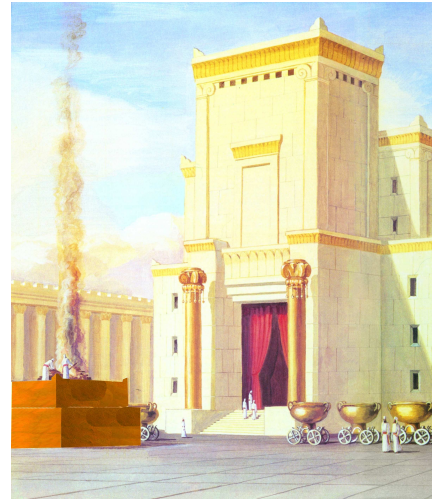
מזבח בית ראשון עשוי אבן ומצופה נחושת. בכמה מקראות מכונה מזבח בית ראשון "מזבח נחושת", ולדעת כמה מפרשים היה מאבן ומצופה נחושת. אפשר שדברי רבי נתן בסוגיה כאן אודות מזבח של שילה, שהיה של אבן ומצופה נחושת, נועדו גם להסביר את מזבח בית ראשון.

לפרש גם את הפסוק בדברי הימים על המזבח שעשה שלמה, "ומשום דקאי במקום מזבח הנחושת, וחילופו הוא, קרי ליה מזבח הנחושת" 18 . במדרש תנחומא (תרומה סי' יא) אמרו על כך: "ולפי שהיה יודע [שלמה] שמזבח הנחושת שעשה משה היה חביב לפני הקב"ה הוציא שם המזבח שבנה מזבח הנחושת". נראה שכוונת המדרש לומר שלא רק הפסוקים קראו כך למזבח, אלא זה היה שמו בפי העם.