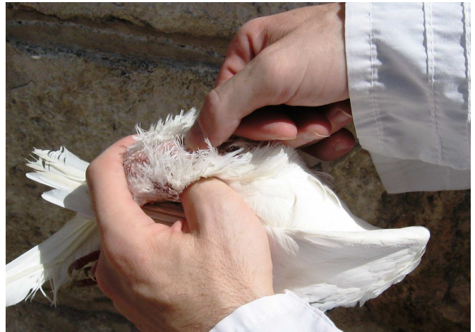
שיטת רב על פי הרמב"ם. העוף בתוך כף יד שמאל, צואר העוף נכרך על אגודל יד שמאל, והאגודל של ימין חופשי למלוק.

לשון הרמב"ם (שם): "ואם שינה ואחז מכל מקום – כשרה". הרדב"ז כתב שמקור דבריו הוא מסברה, אבל מדברי הרמב"ם בפירוש המשנה (זבחים ז,א-ג) יש ללמוד על מקורו: במשנה שם נאמר: "חטאת העוף שעשאה למטה כמעשה חטאת לשם חטאת – כשרה", והרמב"ם התקשה בשאלה מה החידוש בדבר ומדוע נקטה המשנה לשון דיעבד: "שעשאה... כשרה" 4 , ופירש: "רוצה לומר, ואפילו שינה במליקתה". ובהמשך: "ומותר לאוכלה ואף על פי ששינה במליקתה ולא מלקה כמו שאמרנו בסדר מליקת חטאת העוף בפרק שלפני זה, לפי שאותו הסדר למצוה, ואם שינהו