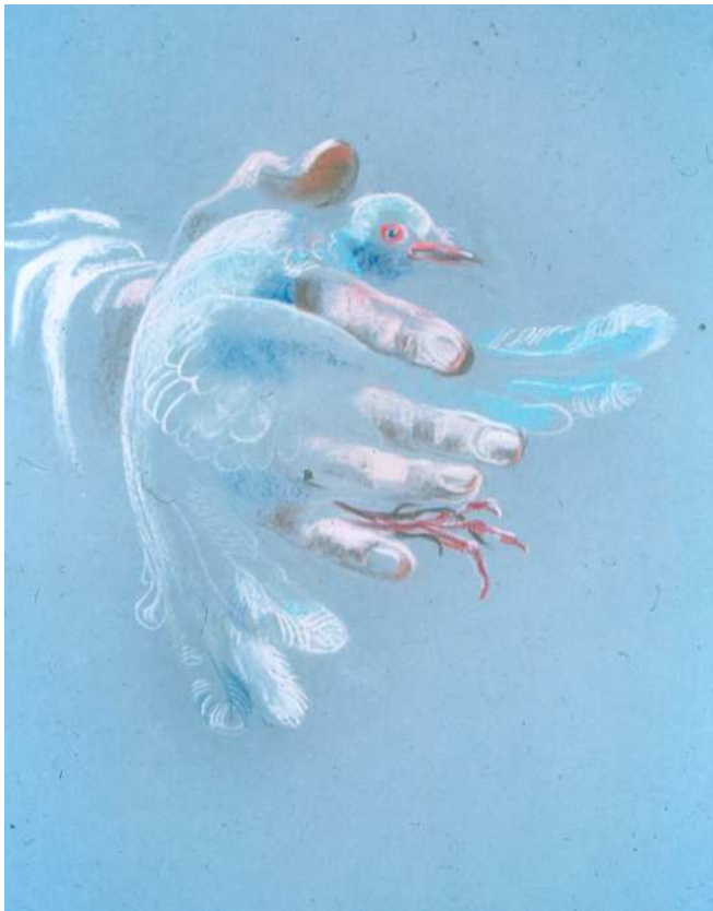
שיטת המתניתא על פי השיטה מקובצת – צד שני. אותה שיטה נראית בציור זה מצד אחר.

לאחר מכן מובאת ברייתא דומה ("במתניתא תנא", המובאת גם בתוספתא פ"ז ה"ב), אלא שהיא מסיימת "ומותרת צוארה על רוחב שתי אצבעות", מצידן הפנימי (רש"י). הגמ' מבארת, שלדעה זו "ציפרא מלבר", מחוץ לכף היד 2 . רש"י אינו מפרש כיצד נאחזים הכנפיים והרגליים לשיטת המתניתא, ונראה שלדעתו אין בנקודה זו הבדל בין שתי השיטות. ברם, ר' עובדיה מברטנורא (זבחים ו,ד), הנוקט כדברי המתניתא, כותב שהגפיים נאחזות בין הזרת לקמיצה 3 . דעה שלישית בברכת הזבח ובחסידי דוד (פ"ז ה"ב), שהגפיים נאחזות בין הקמיצה לאמה, אף זאת כדי לאפשר את מתיחת הצואר על האצבע והאמה.