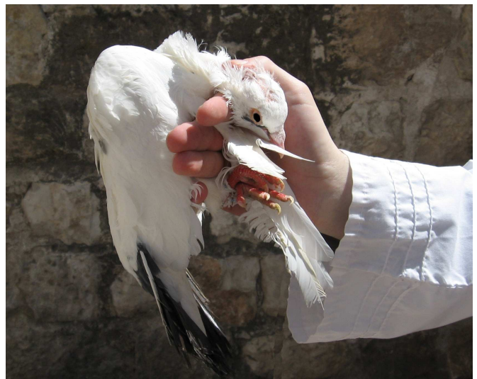
שיטת המתניתא על פי השיטה מקובצת. העוף מוחזק ביד ימין מחוץ ליד, שתי הכנפיים בין האצבע לאמה ושתי הרגלים בין הזרת לקמיצה (חלוקת האצבעות - כמו לשיטת רב). באופן זה מובן יותר כיצד ניתן למלוק וגם לאחוז באותה יד.

5. כך ביארו את הרמב"ם בחק נתן וקרן אורה ומעיל שמואל, כולם בדף סו,א. יש