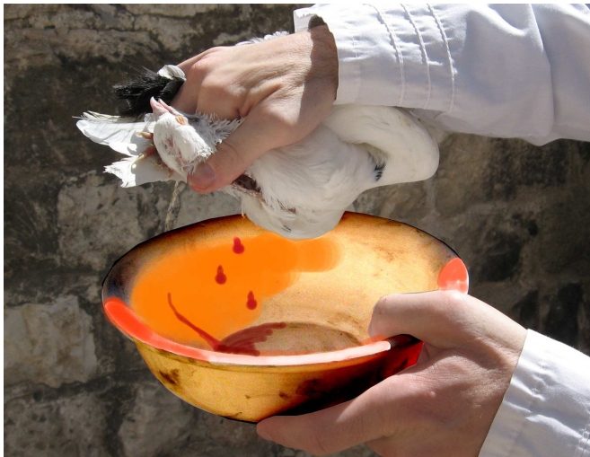
קבלת דם העוף בכלי שרת. הזאת דם העוף נעשית ישירות מגופו, והגמרא (צב,ב) מסופקת האם מתן דמו בכלי פוסל אותו.

לכאורה בתוספתא (זבחים א,ח) הדבר מפורש: "דם כל הניתנין למעלה – מקבל בכלי ונותן ביד, ואם נתן בכלי פסול. דם כל הניתנין למטה – מקבל בכלי ונותן בכלי, אם נתן ביד פסול.... אבל בעוף אינו כן, אלא שבעולת העוף ממצה בעצמו ובחטאת העוף מזה וממצה מעצמו, כולן שקיבלו בכלי והיזו ביד, ביד והיזו בכלי – הרי אלו פסולין". וכן כתב בפירושו 'תוספות אחרות' לספרא (ויקרא חובה פרק