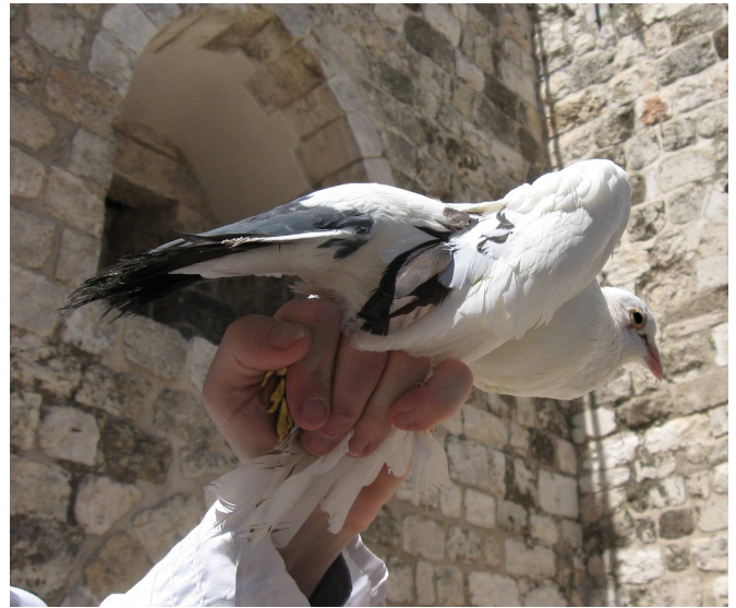
שיטת המתניתא על פי הרע"ב. הכנפים בין הזרת לקמיצה, והרגלים בין האצבע לאמה. בצורה זו ראש העוף פונה לכיוון הזרת, וקשה למלוך כן, אלא שהרע"ב לשיטתו שאחיות העוף נעשית ביד שמאל.

ואף היתה הוה-אמינא שהדבר מעכב, שכן היה מקום לראות זאת כהצעה בעלמא שאין חשיבות לאופן ביצועה המדויק.