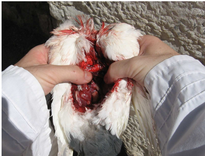
מראה העוף לאחר השיסוע. השיסוע הוא פתיחה חלקית, ללא ניתוק בין חלקי העוף, ככתוב "לא יבדיל".