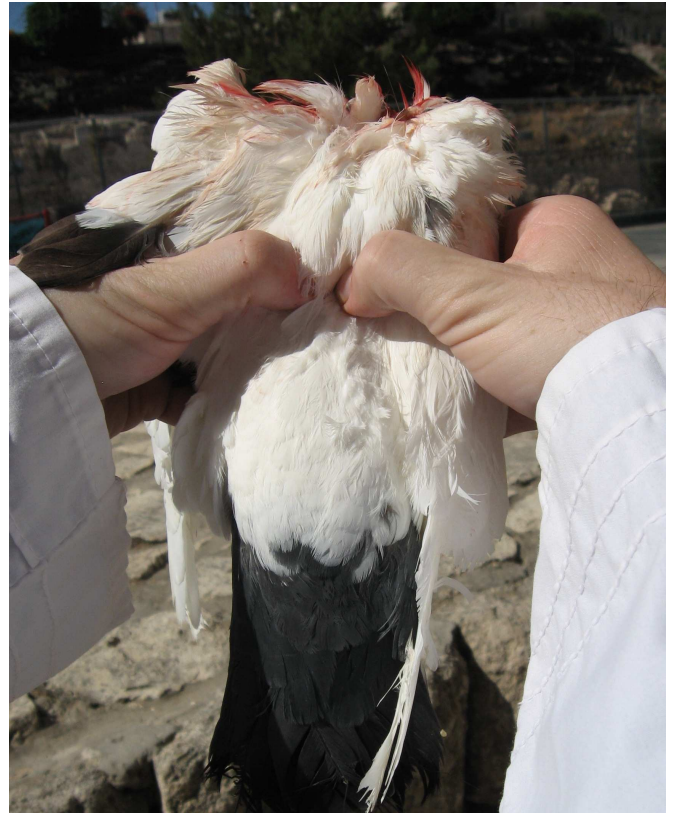
שיסוע העוף. "ושסע אותו בכנפיו" – מגבו, בין כנפיו.

ח), בהבחנתו בין "אזהרה" (איסור לאו) לבין "שלילה" (הודעת התורה על העדר חיוב). שהפסוק "לא יבדיל" האמור בעולה הוא שלילה ולא אזהרה. נראה מדבריו שם שלמד זאת מהדין שאם הבדיל הרי זה כשר 14 (ועיין שפת אמת כאן, שתמה על הרמב"ם). ראייה מסוימת לשיטתו מסדר הדברים במשנתנו, שהפיסקה "ואם הבדיל כשר" נפרדת מ"לא הסיר המוראה... ולא ספגו במלח, כל ששינה בה מאחר שמיצה את דמה – כשרה", ולפי הרמב"ם החלוקה מוסברת יפה: "אם הבדיל כשר" היינו אפילו לכתחילה, ואילו "לא הסיר" וכו' כשר רק בדיעבד (אך יש מקום להסביר את החלוקה בין הפסקאות באופן אחר, שהמשנה מפרידה בין העושה עבירה לבין המבטל מצוה).