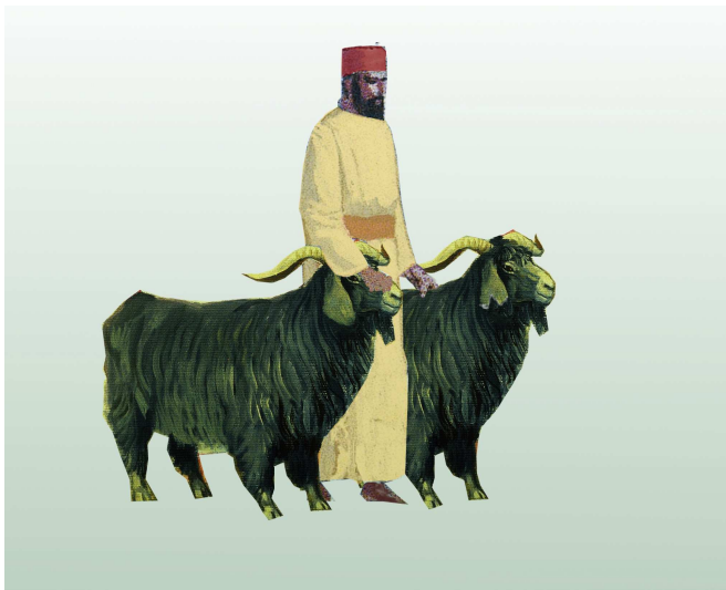
חילול בהמות זו על זו. בהמה שנפל בה מום, אסור להמירה בבהמה אחרת בלשון "זו תמורת זו". לעומת זאת, המחלל על בהמה אחרת בלשון: "זו מחוללת על זו" לא עבר על איסור תמורה. לדעת הרמב"ם הדבר מותר לכתחילה, ומדברי רש"י משתמע שהדבר אסור.

בפירושו למצב הראשון, תערובת זבחים באיסורי הנאה, המפרש (ד"ה ירעו עד שישתאבו) אינו מגיה, ומאידך גם אינו מזכיר כלל את המכירה, וכתב: "יביא מעות כנגד דמי היפה... ויאמר: כל מקום שהוא הזבח [ולא: שהן מעות הזבח] יהא מחולל על מעות הללו". נראה שבגרסה שלפניו לא נאמר כלל "וימכרו" בבבא ז' 14 . אך יש שהבינו מדבריו על המשפט הבא במשנה, שהוא מקיים את הגירסה "וימכרו" במשפט שקדם לו, ותמדהו על כך (נימוקי חיים). אכן, יש מקום לחלק בין המקרים: אמנם אין חובה למכור, אבל במקרה הראשון המכירה תועיל לו שלא יצטרך להביא מעות נוספות מביתו (אם ימכור את הבהמות בנפרד זו מזו, ויוכל להתנות על קבוצת המעות היקרה ביותר כנ"ל), ואילו במקרה השני, כשכל המעות קודש, בלאו הכי יצטרך להביא מעות אחרות, ולא הרוויח כלום במכירה.