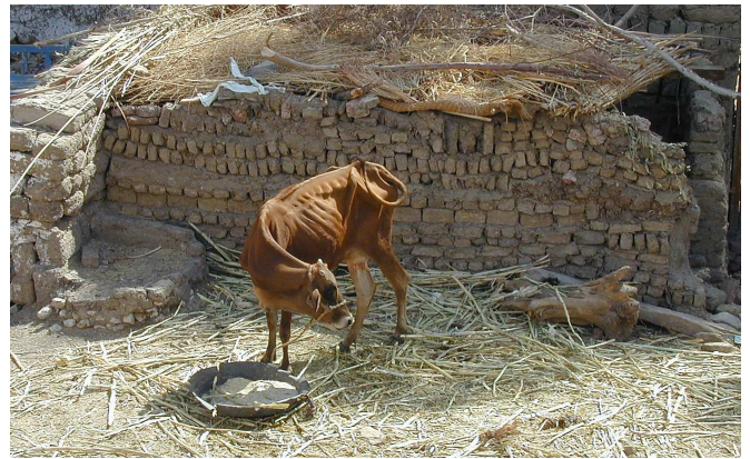
הכנסה לכיפה. בחטאות המתות, כגון חטאת שמתו בעליה, קיימת הלכה למשה מסיני שימותו ולא יפדו, וזאת על ידי הכנסתן ל"כיפה" ומניעת מים ומזון עד שימותו. נחלקו ראשונים האם כך הדין גם בזבחים שנתערבו בחטאות המתות ושור הנסקל.

יש שסוברים שגם לדעת תוס' אין להורגם בידיים, וקושייתם כך: ר' יהודה בסנהדרין שם סובר שכונסים את התערובת לכיפה, וחכמים פוטרם אפילו מהכנסה לכיפה, ומכאן הסתירה (קדשי דוד; נימוקי חיים עד,א; ועיין נודע ביהודה מהדו"ק יו"ד סי' פד). כך כותבים תוס' ישנים ביומא (נו,א ד"ה ונברור), שיש "לכונסם לכיפה לסקול השור", כלומר, שבכך ימות השור ויתקיים "ובערת הרע", ולא בסקילה ממש. כדעה זו משתמע ברמב"ם בפירוש המשנה כאן: "יתבאר לך בפרק השני דתמורות שיש מיני חטאות מתות, כלומר שמניחין אותן עד שימותו... ולכן אם אירעה תערובת... מניחים את כולם עד שימותו כמו שיתבאר בתמורות", ומשמע שמיתת התערובת כמיתת החטאות המתות (זבחי אפרים דף קנב-ד). נראה שהטעם לשיטה זו, שאסור להרוג קדשים בידיים, משום "לא תעשון כן לה' אלהיכם" (דברים יב,ד; עיין עבודה זרה יג ע"ב), והריגתם מותרת רק בדרך גרמא, כדברי הגמ' בשבת (קכ ע"ב): "לא תעשון כן... – עשייה הוא דאסור, גרמא שרי".