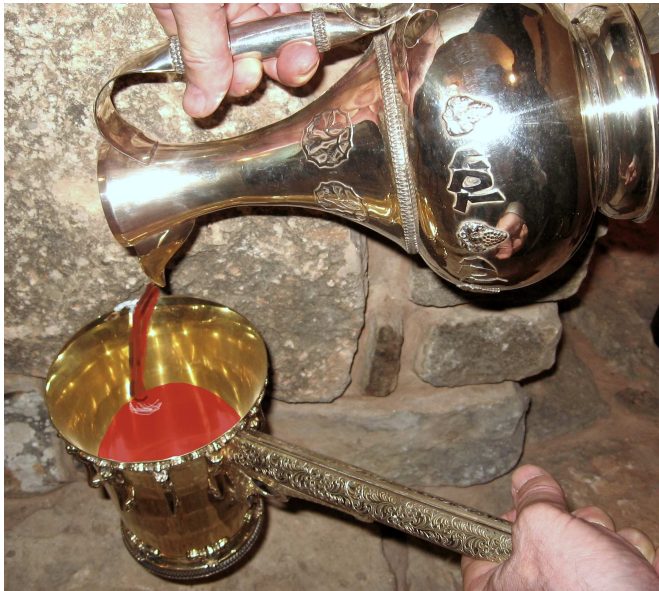
דם שנתערב ביין. על פי המשנה, אם הדם היה ניכר ביין, אילו היה זה מים ("רואין") – הדם עדיין ראוי לזריקה.

תוס' (ד"ה הא דרביה) מרבים להקשות על רש"י (ראה מערכה קפו), ופירשו אחרת, שהתמיהה היא מדוע ר' יהודה לא אמר במי חטאת שאינם בטלים כלל, כשיטתו שמין במינו אינו בטל, ועל כך תשובת אביי, שר' יהודה עצמו סובר שמין במינו בטל ברוב 4 . על פי זה נזקקו תוס' להוסיף, שר' יהודה עצמו מיקל במין במינו אף יותר מרבנן (שאומרים "רואין" גם בתערובת דם חולין בדם קדשים), וסובר שבמקרה זה, כגון מי חטאת במים רגילים, די ברוב ולא אומרים "רואין". רק בחלב ויין לבן (וכן מי רגלים, ראה מערכה קפו) אמר ר' יהודה "רואין", כי הם שונים במהותם ממים, ודומים להם רק בצבעם.