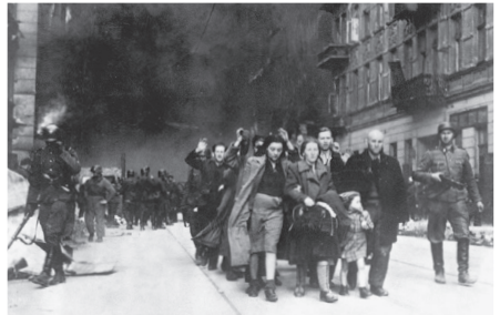
מורדי הגטו מובלים על ידי חיילים, מאי 1943