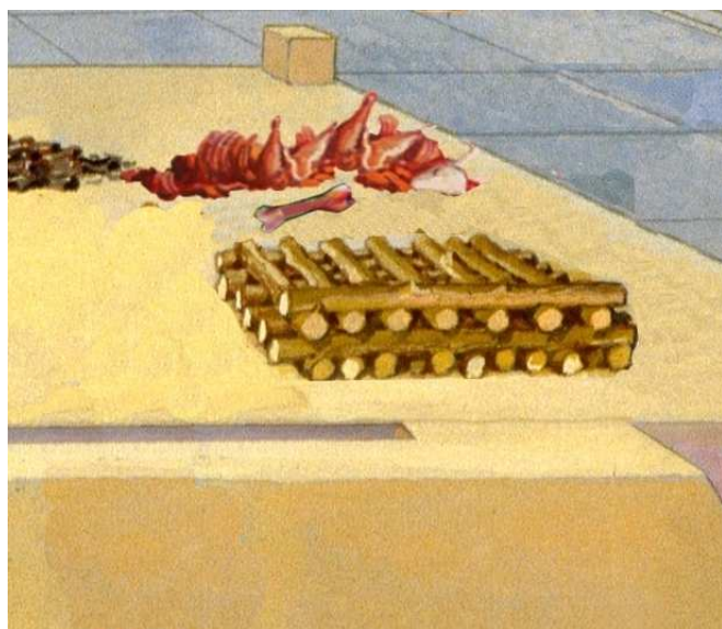
עצם שפירשה בראש המזבח לכיוון המערכה. רבי זירא מחדש שבמקרה זה אפילו רבי מודה שהעצם תוקטר. רש"י מפרש שהסוגיה בהמשך סותרת את הדעה הזו, אולם כמה מפרשים נקטו שזוהי מסקנת הסוגיה.

בשטמ"ק (אות י) מופיעה גרסה אחרת בדברי רש"י (שמה מהדורה אחרת של פירוש), לפיה המילים "ואפילו פירשו" אינן תמיחה, אלא ציטוט מדברי תנא קמא בברייתא האומר שעצמות שפירשו יוקטרו, ועל כך אומר רבה את חילוקו (בלא המילים "הכי קאמר") בין פרישה שקודם זריקה לבין פרישה שלאחריה. נמצא שאין לדבריו קשר לחילוקו של רבי זירא בדעת רבי. זוהי גם נוסחת תוס' (ד"ה לא שנו, כפי שמבאר הב"ח אות א), וכך נקטו מגדולי האחרונים, שכך מיושב יותר פשט הגמ' (ברכת הובח 12 ; פנים מאירות). גם בפירוש 'תוספות אחרות' (לאחד מבעלי התוס') על הספרא (ויקרא נדבה פרק וט) כתב בפשטות את החילוק בין פרישה כלפי מעלה או מטה, כלומר שאין בגמ' מחלוקת על כך.