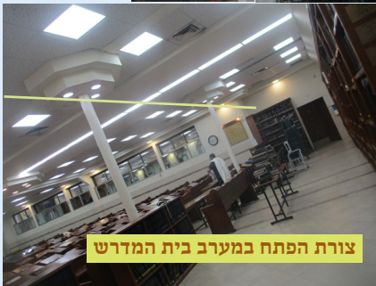
צורת הפתח במערב בית המדרש