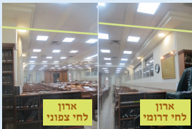
ארון לחי צפוני