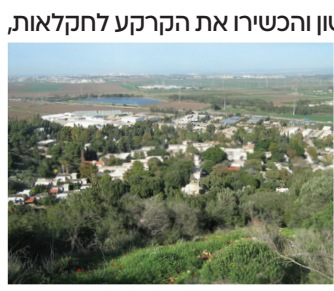
מראה קיבוץ יגור מהכרמל

קיבוץ יגור נמצא ממזרח להר הכרמל, כתשעה קילומטרים דרומית-מזרחית לחיפה, ונמצא בפתחו של נחל יגור. זהו אחד מהקיבוצים הגדולים ביותר בישראל. הוא נוסד בשנת 1922 על אדמות שקנה יהושע חנקין, ונקרא כך בהשפעת הכפר הערבי הסמוך 'יאג'ור.