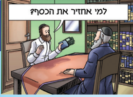
למי אחזיר את הכסף?

"אני רוצה לחזור בתשובה", פתח האיש את דבריו כשהוא יושב מול הרב. "עשיתי עברות שונות, אבל החלטתי שאני רוצה לחזור למוטב. כבוד הרב, נגבת כסף מנר צדקה, והוא נפטר בלא יורשים. מה אעשה בכסף?" - "הכסף שיהי לך, בגלל שאחרי שגור הצדקה נפטר בלא יורשים כל אחד יכול לזכות בממון שלו.