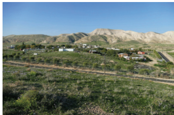
מבואות יריחו

מבואות יריחו הוא יישוב קהילתי- דתי בבקעת הירדן, שהוקם בשנת 1999 וצופה אל העיר יריחו ונופי המדבר. היישוב מתאפיין בקהילה אידיאליסטית ומגוננת המשלבת חקלאות, חיי רוח וערבות הדדית בין תושביו. ייחודיותו המרכזית טמונה באירוח מוסדות חינוך טיפוליים, ובראשם כפר הנוער והחווה הטיפולית "גינת עדן". "גינת עדן" מהווה בית חם לנערות המתמודדות עם קשיים רגשיים וחברתיים, ומציעה להן מסלול שיקומי המשלב לימודים עם עבודה חקלאית וטיפול בבעלי חיים. הנערות משתלבות במארג החיים היישובי וזוכות למעטפת קהילתית תומכת ומעצימה. ביישוב הוקמה בשנה האחרונה גם מכינה קדם צבאית.