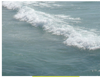
גל בתוך הים

לא) הביא בשם האליה רבה (ס"ק כג), בשם שיירי כנסת הגדולה (הגהות בית יוסף אות מ), שבזמננו נהגו שגם הטובל ידיו בים הגדול מברך "על נטילת ידים", משום שמי הים ראויים לשתיה על ידי רתיחה.