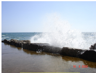
גל באויר שנתלש