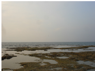
שלולית סמוכה לים